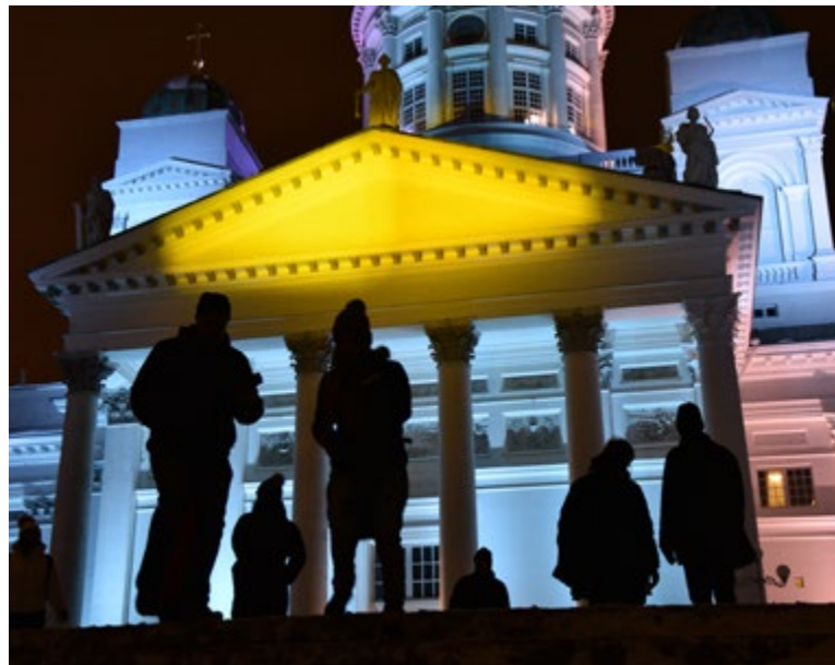
Valotaiteen varjolla kohtaamisia tutuissa paikoissa.

”Lux on hyvä esimerkki siitä, miten säännöllinen suurehko tapahtuma järjestetään hiljalleen kasvavana kaupungin orkestroimana tapahtumana vuosittain.”