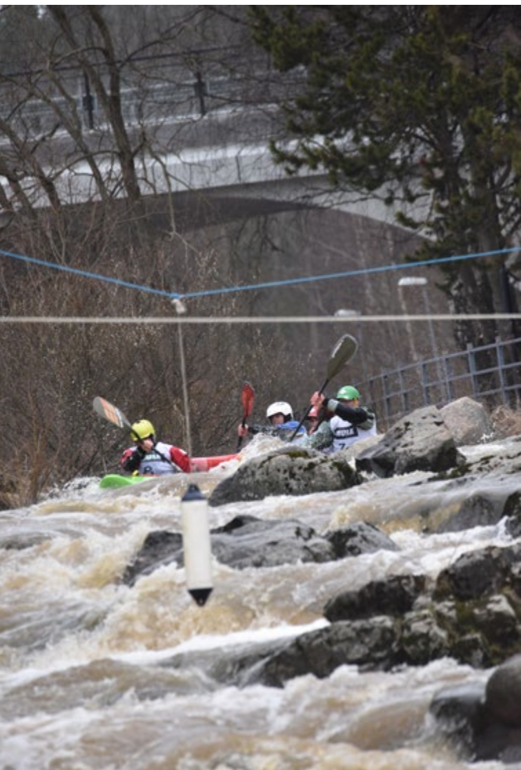
Rakennetun ympäristön hyötykäyttöä iceBREAK-tapahtumassa.

Pokémon Go käynnisti kiinnostuksen koko kansan kaupunkisuunnistukseen. Harrastajaryhmänä olivat niin geokätköilijät kuin Pokémon-tarinan ystävätkin. Pokémon Go liikuttaa edelleen perheitä ja ystävyksiä rakennetussa ympäristössä. Geokätköilystä on tullut jo aiemmin maailmanlaajuinen ulkoiluharrastus, jossa etsitään satelliittipaikannuksen perusteella kätköjä. Niin kätköjen piilotus kuin etsintä kuuluvat geokätköilyssä Suomessa