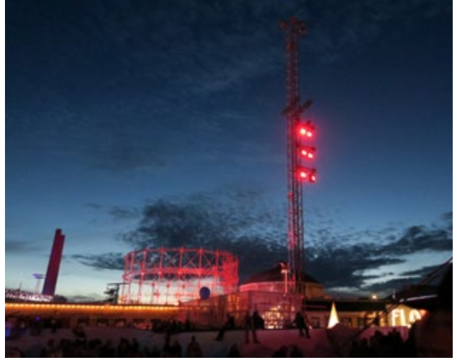
Ympäristö muuttuu tapahtuman näköiseksi.

Lux on hyvä esimerkki siitä, miten säännöllinen suurehko tapahtuma järjestetään hiljalleen kasvavana kaupungin orkestroimana tapahtumana vuosittain. Se laajenee jatkuvasti uusilla toimijoilla. Säännöllisyys tutussa tapahtumassa asettaa kaupungille aikataulun, jolla varmistaa halutut palvelutarjoajat tapahtumaan. Asukkaat, turistit ja satunnaiset ohikulkijat varautuvat jo ennakoon säännölliseen ja kiinnostavaan tarjontaan. Osallistujalle säännöllisyys varmistaa paitsi tuttuun tapahtumaan osallistumisen myös tapahtumareitin ennakkoinnin ja ystäväporukan kokoamisen pidemmäksikin ajaksi yhteisen teeman avulla yhteen.