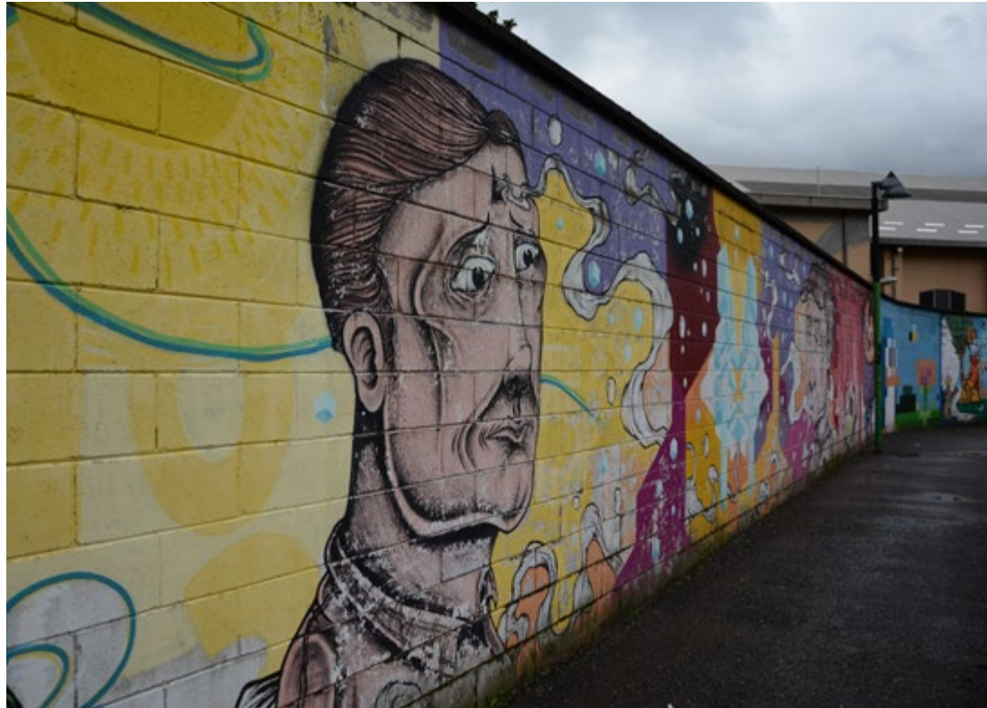
Graffititaidetta sivukujalla Italian Leccossa.